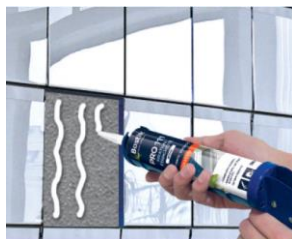
Collage de matériaux