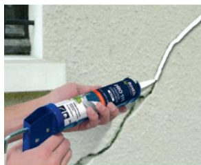
Rebouchage de fissures