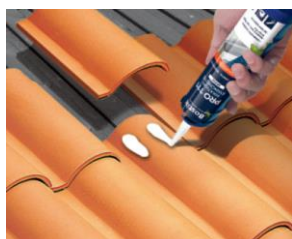
Étanchéité & calfeutrement