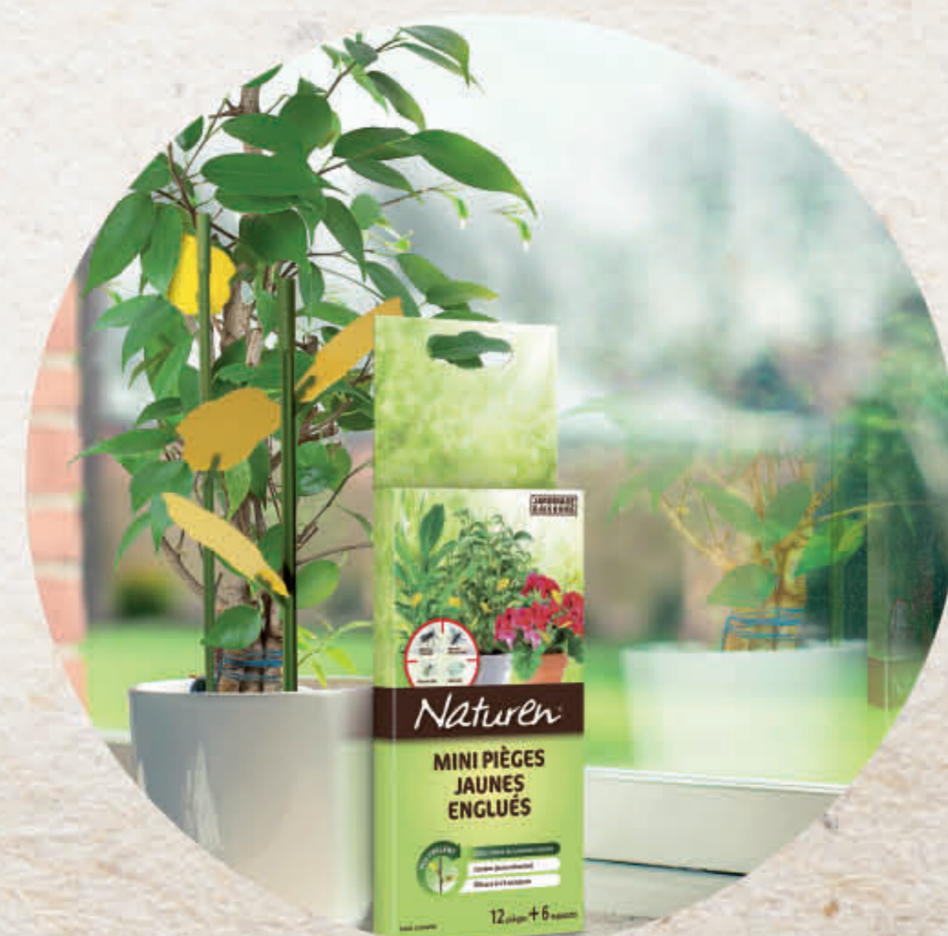
Mini-pièges jaunes pour plantes en pots

Cette méthode est basée sur l'attraction des insectes pour certaines couleurs. La couleur jaune va attirer les insectes volants suivants : les aleurodes, les pucerons, les noctuelles, les thrips, les cicadelles qui seront neutralisés par adhérence à la surface engluée.